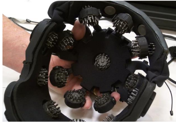
Şekil 2 – DSI Başlık

GDV ekipmanı araştırma için değerli bir alet oldu. Parmak uçlarının etrafından çıkan gaz boşaltımının, koronanın karakteristikleri bedendeki spesifik bölgede ölçülen enerji miktarına dayanarak bunu genel sağlık haline tercüme ederek hesaplanır. Parmak ucu koronasının bölgeleri ne kadar büyük ve sabit olursa (bakınız Şekil 1), enerji alanı o kadar tutarlı ve stabil görünür.